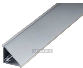
příklad těsnící ukončovací lišty k pracovním deskám