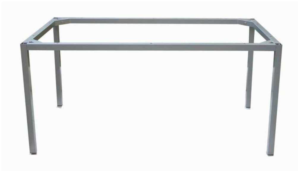
příklad podnože jídelních stolů: Alupress SKP-1 (na vyobrazení podnož odlišných rozměrů)

Podnože jídelních stolů v. 750 mm – kovová stolová konstrukce tvořená rámem pod deskou stolu a čtyřmi nohami čtvercového průřezu 40x40 mm, povrchová úprava v odstínu RAL 9006 stříbrná