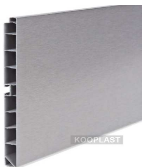
příklad nábytkového soklu