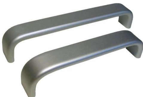
tvarový příklad nábytkové úchytky