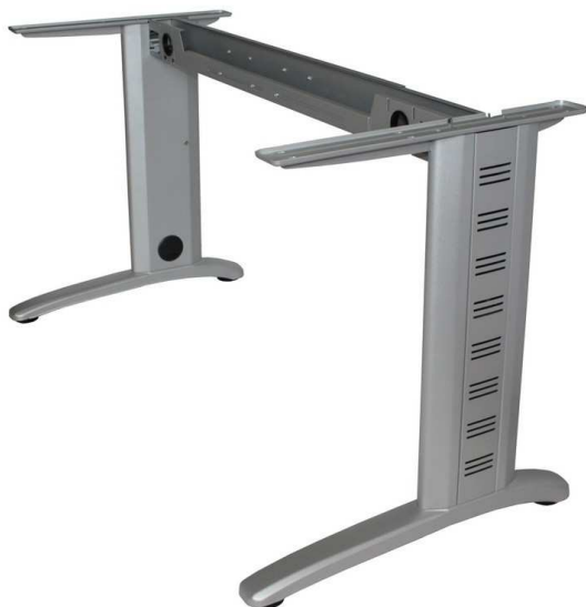
tvarový příklad podnože pracovních stolů

Podnože pracovních stolů – kovové kancelářské stolové konstrukce se skrytým vertikálním i horizontálním vedením kabeláže, tvořené spodními a horními ližinami, postranními nohami (bočnicemi) š. cca 200 mm a spojovacím mostem, povrchová úprava v odstínu RAL 9006 stříbrná