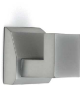
tvarový příklad háčku – Tulip Fera satin chrom